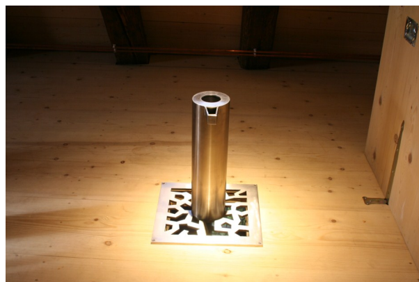
Spitze des Quellturms im Suso-Haus