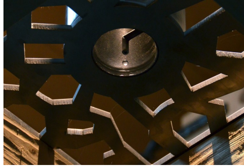
Quellturm mit fallendem Tropfen